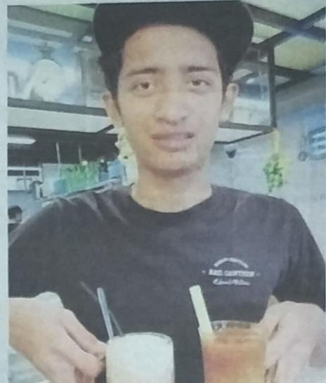
A waiter holds up drinks, which require the use of straws. Vendors

She added that they were open to the idea of paper straws but such straws cost more, while providing metal straws may seem like a better option but people may question the hygienic aspect of it.