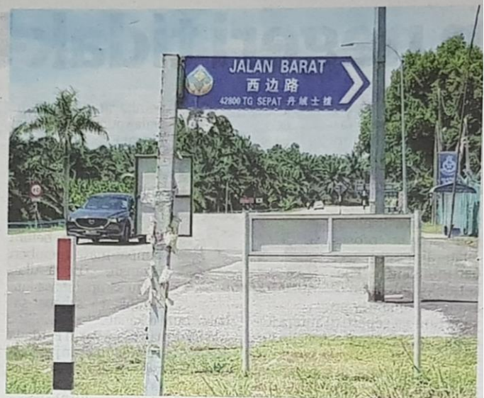
PAPAN tanda taman perumahan dan nama jalan (kanan) di Tanjong Sepat ini adalah antara begitu banyak yang masih menggunakan tulisan Cina di Kuala Langat, Selangor.