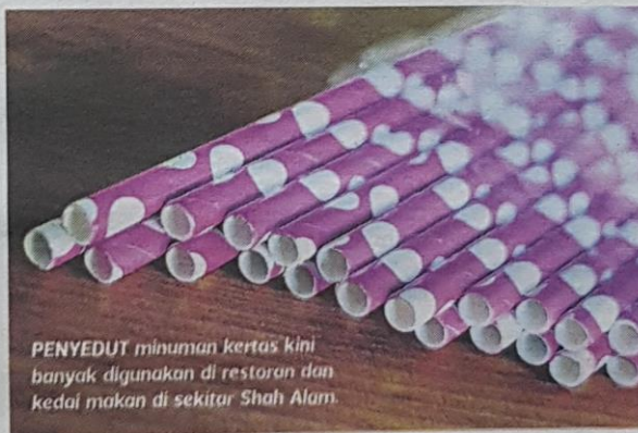
PENYEDUT minuman kertas kini banyak digunakan di restoran dan kedai makan di sekitar Shah Alam.