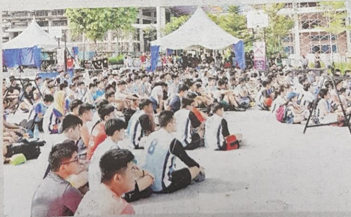
Peserta Kejohanan Gravit8 Streetball 3 on 3 Challenge 2019 berkumpul di Taman Rekreasi Gravit8 sebelum perlawanan.

“Lokasi ini sangat bagus untuk kita berkumpul. Setiap tahun kami mengadakan pelbagai aktiviti termasuk larian amal yang disertai 3,000 orang,” katanya.