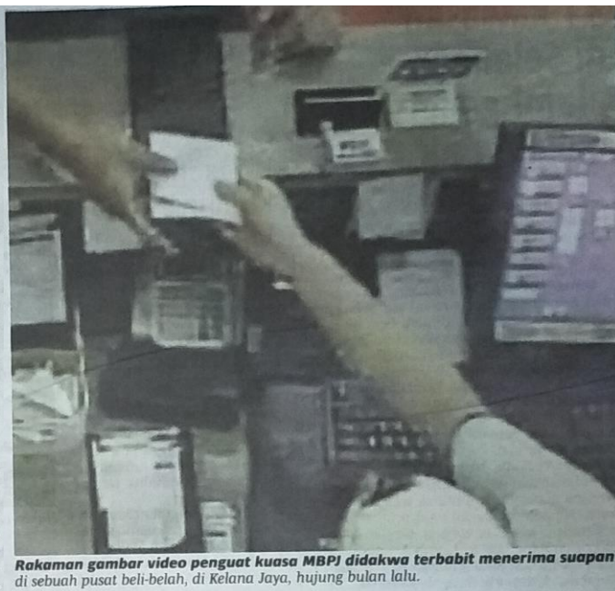
Rakaman gambar video penguat kuasa MBPJ didakwa terbabit menerima suapan di sebuah pusat beli-belah, di Kelana Jaya, hujung bulan lalu.

Ronnie berkata, kegiatan rasuah seperti itu sudah lama wujud, namun tiada bukti kukuh sering membantutkan tindakan terhadap penerima dan pemberi rasuah.