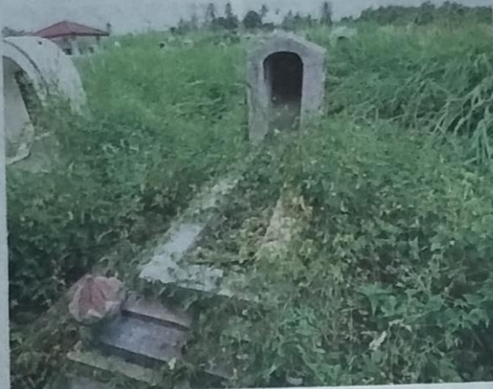
Kapar burial ground is overgrown with grass and plants covering the tombstones. (Right) Rubber wood logs are used for the open-air funeral pyre at the Kapar cemetery.