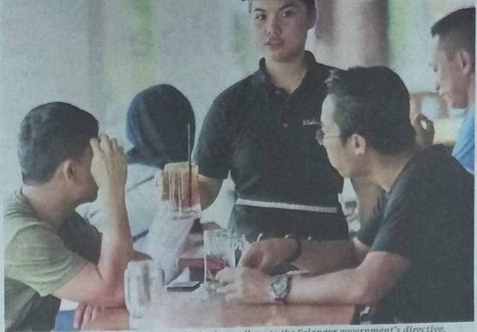
Restaurant operators hope customers will help them adhere to the Selangor government's directive.

"A suitable and cost effective alternative is needed as a long term solution to ensure that our