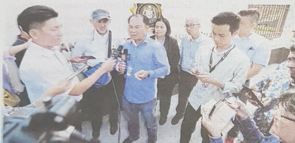
LIU (tengah) bersama pemilik kedai mengadakan sidang media dan membuat laporan kepada SPRM berhubung kes rasuah dalam kalangan pegawai PBT.

hakan ladang serai secara man itu, terdapat beberapa Menjelaskan lanjut, beliau