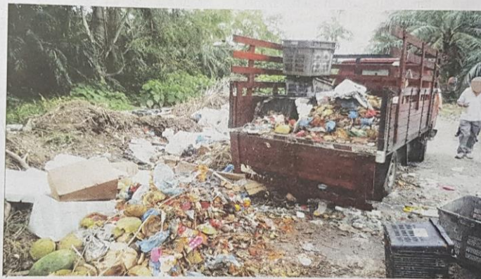
MDKL menawarkan ganjaran wang tunai RM100 kepada pemberi maklumat mengenai aktiviti pembuangan sampah haram di daerah Kuala Langat.

"Maklumat disampaikan kepada MDKL ini menggunakan asas aduan yang pertama diterima ( first-come basis ) dengan mengambil kira maklumat yang lengkap, tepat dan