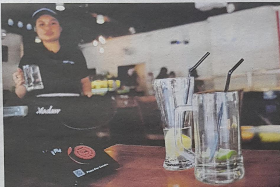
BEBERAPA premis memberikan penyedut minuman atas permintaan pelanggan.

Loy Sian berkata, premis juga dilarang menyediakan penyedut plastik di kaunter untuk diambil secara bebas dan pelanggan hanya boleh memintanya sekiranya memerlukan.